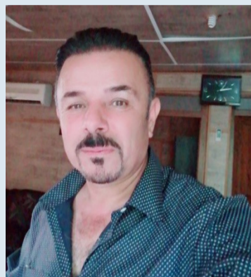
حه سه ن ساه