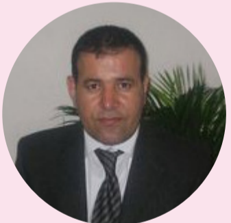
شيعرى : هبوا زهنگه نه