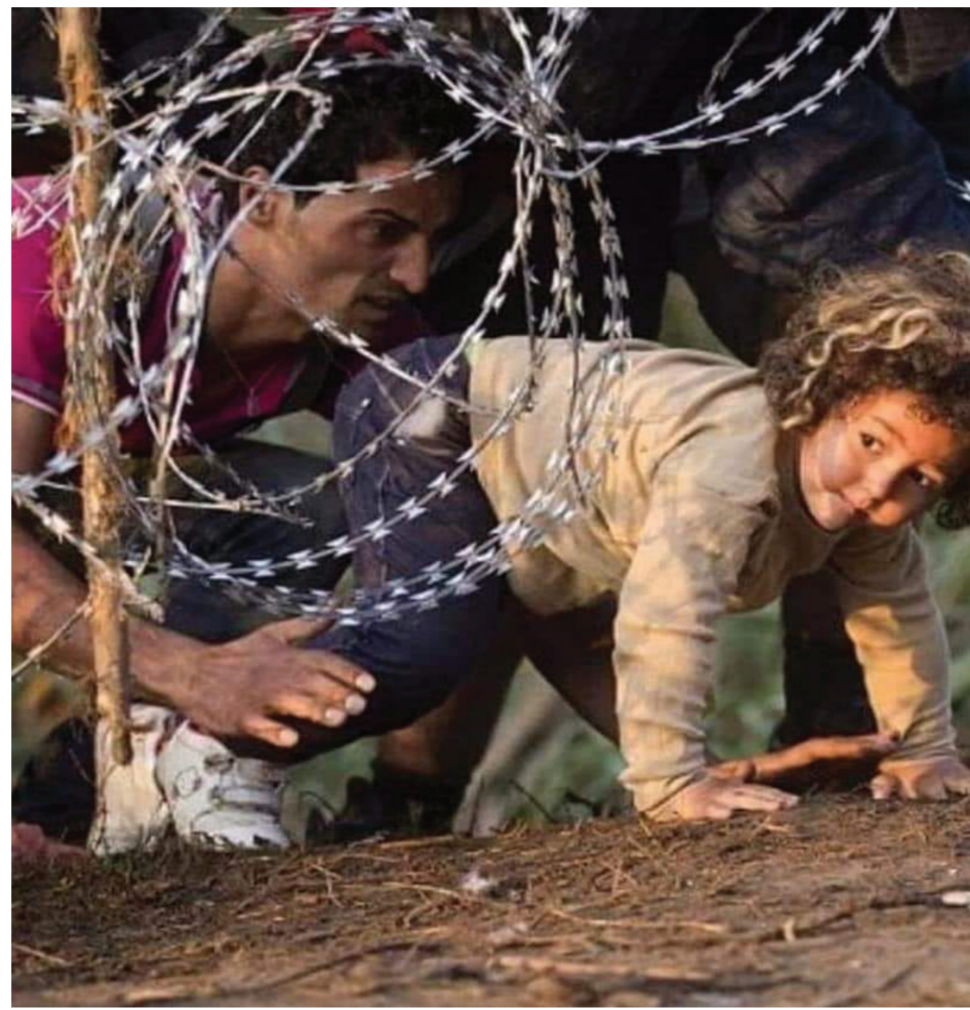
الحرب والقتال في العراق وأفغانستان ، سوريا واليمن وليبيا ، الانظمة الدكتاتورية في منطقة الشرق الأوسط ، الحركات والحزب ، المرو والمجاميع الشوفينية الرجعية والإسلامية والحركات القومية البرجوازية في المنطقة والتي تحافظ مجتمعة على النظام الرأسمالي والنيوليبرالي ، دفعت بالملايين الى الهجرة والتشرد، ففي العراق ستة ملايين وفي أفغانستان سبعة ملايين وسوريا ستة ملايين هم من تشردوا جراء هذه الأوضاع ان الوقوف بوجه هذه المظالم ، بوجه هذا النظام هذه القوى، للحيلولة دون إجبار البشر على الهجرة والتشرد وطلب اللجوء ، للحيلولة دون إجبارهم على العيش تحت الخيام

والحرمان من العمل والعيش الطبيعي، من التعليم والحقوق الاساسية الولية، هي المهمة الازنية للبروليتاريا والاشتراكيين والحرار . الجماهير في العراق وإقليم كردستان جربوا كل هذه المحن بجلدهم وعظامهم . بدأ من الحروب المستمرة والقتل الجماعي والاختطاف والاعتقال، مروراً بالتعذيب والسجون، وصولاً الى الفقر والجوع ، الفساد والرجعية ، كل ذلك تم بمشاركة أمريكا وحلفاءها الأوروبيين خلال الثلاثين سنة الماضية، علاوة على دور إيران وتركيا ودول الخليج وروسيا . السلطة الحالية في إقليم كردستان، هي المسبب المباشر لهذه الهجرة الجماعية المستمرة للشباب من الإقليم. عدد محدود من الأحزاب والقوى والمسؤولين وكبار الرأسماليين هم الذين استولوا على مجمل مفاصل الحياة ، هذه الأحزاب والقوى هم الذين يدفعون بالاقليم ، بين الحينة والأخرى، الى مشارف حرب داخلية وحولوا هذه المنطقة الى ميدان تلعب فيه الدوائر المخابراتية والارهابية، بحيث أصبح إقليم إقليم قمع فيه أي صوت حر . خلال انتفاضة أكتوبر 2019 في بغداد ومدن الوسط والجنوب ، وديسمبر ( كانون الأول ) 2020 في كردستان العراق نزل الى الشارع مئات الآلاف من العمال والشباب والمرأة ضد الفقر، انعدام فرص العمل والفساد، ضد الحرب وسلطة الميليشيات والسياسة الامريكجية وضد إيران وكافة أحزاب السلطة ، أظهروا خلالها بطولات وجسارة فائقة، حصيبتها كانت 800 ضحية ، و 30 ألف جريح وآلاف المسجونين . وفي كردستان العراق تم اضرار النار في مزارع كافة الأحزاب ، جوبهت هذه الاعتراضات من قبل السلطة بالاعتقال والقمع . هناك جماهير متريضة، مفقرة ولدت امانها أي فرص للعمل ، تقع مباشرة تحت طائلة