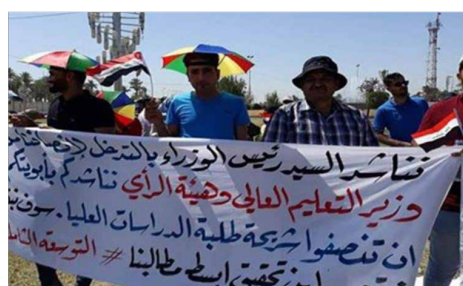
تقرير اعته بسمة لطيف

تواصل وتتصاعد احتجاجات طلبة الدراسات العليا على النفقة الخاصة في الخارج يوما بعد يوم. ففهمو وشجون الاطفال الذين اخفوا الدراسة واخرين انهم لم يحضرو الانتهاء من اجراءات الحصول على الشهادة من الجامعات التي اقرت لها الوزارة وبرصانتها العلمية. يعانون الاربين بعد ان جدوا واجتهادوا وتحملوا الاوقات والظروف الصعبة العالية والمعنوية لاجل انهم يتفاهموا. الا انهم وجدوا الوزارة تضع امامهم شروطا في اصلا غير واردة بتعليماتها السابقة حول معادلة واحتساب الشهادات التي حصلوا عليها. هؤلاء الطلبة الدارسين خارج العراق وعلى نفقتهم الخاصة. اصبحوا الآن بين مطرقة الوزارة وحاجتهم للحصول على شرة جدهم العلمي واحتساب الشهادة لهم. فالقرارات والجراءات المحقة التي صدرت من الوزارة غير متوافقة مع نظام الدراسة التي تمت خلال فترة الانتشار وباء كورونا. لذا يطالب المحتجون بالغاء تلك الجراءات وتطبيق بنود التعليمات التي صدرت من وزارة التعليم العالي بخصوص اكمال الدراسة والمعادلة لشهادات بعد التخرج والايخص من اكمال الدراسة بشكل (اون لاين ) اثر تفشي وباء كورونا.