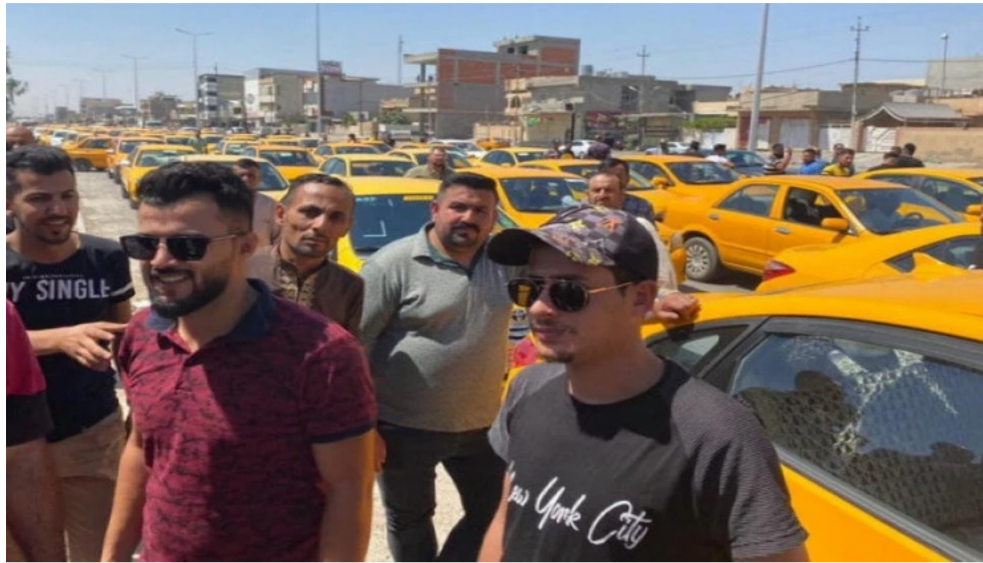
كركوك - الأربعاء 26 آب 2025

شهدت مدينة كركوك، اليوم الأربعاء، تظاهرة جديدة نظمها أصحاب سيارات الأجرة العمومية (التكسي التقليدي) احتجاجاً على عمل مكاتب التكمسي التي تعتمد نظام التطبيقات الإلكترونية، مؤكداً أن هذه المكاتب تتعاقد مع سيارات خصوصية لا تدفع الرسوم السنوية أسوة بسائقي العمومي، وتحصل على طلبات أكثر مما يهدد مصدر رزقهم.