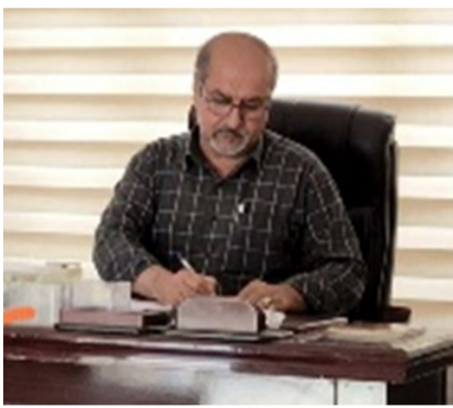
رزگار بایان: جیگری سہرؤکی یہ کیتی سہندیکی کانی کرئکارانی پارنژگای کہرکوک

لنگہر تا نیستا ہاوریہ کی چہ یان کومونیسٹیک لایوایہ ہزکاری کہ لنگہ کی سہرمایہ لہ کوردستان و عیراق، لہرئی "ژندہ بایی" و کیشمہ کیشی کلاسیکی نیوان سہرمایہ دار و پڑونیتاریہا و وک دوو لایہ تی خاوم لیرادی نازاد و یکان لہ بہرامبہر یکنتر بہدست دیت، یان سہرکوت، نامرازیکہ بؤ بہدہستہ یانانی ژندہ بایی زباتر، یان نیمہ چینی پڑونیتاریہا ی پشہ سازی و یکنگرتو و رنکخراومان ہیہ، یان پدہوہندیہ نہریتیہ کونہکان بہ لانیہشہوہ دہتوانن لنگہ گشہی "عقلائی" سہرمایہ دا لاوز بکرتن.... تاد نہوا باشرتہ چارنکی تر